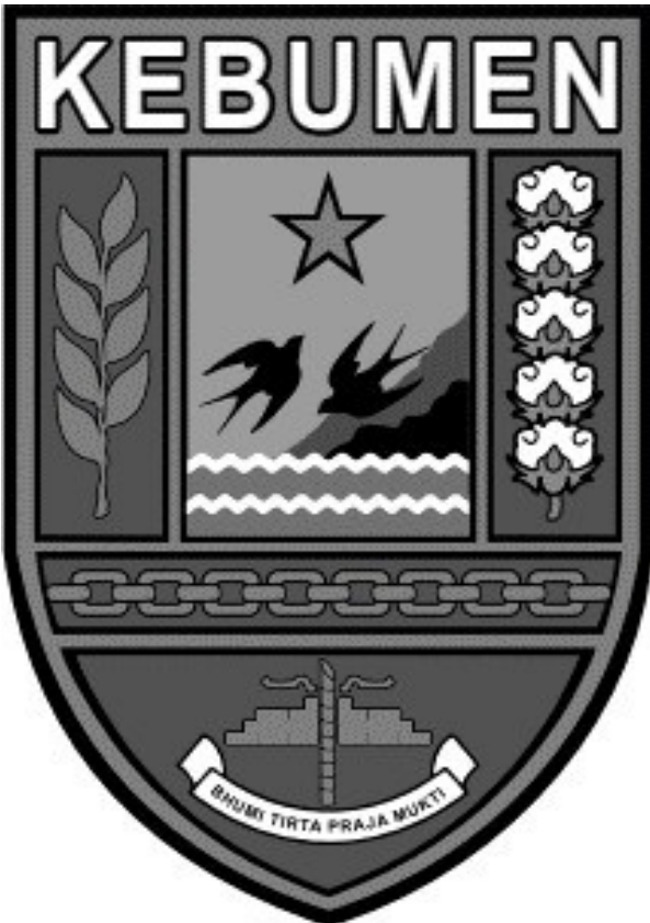
BENTUK DALAM WARNA HITAM PUTIH