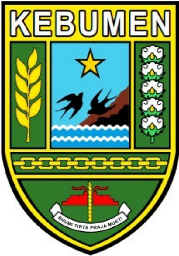
BENTUK DALAM WARNA